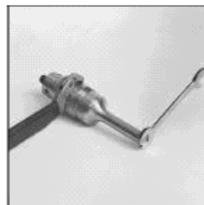
SERRAGE DE LA SONDE