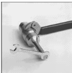
ENLEVEMENT DE LA SONDE